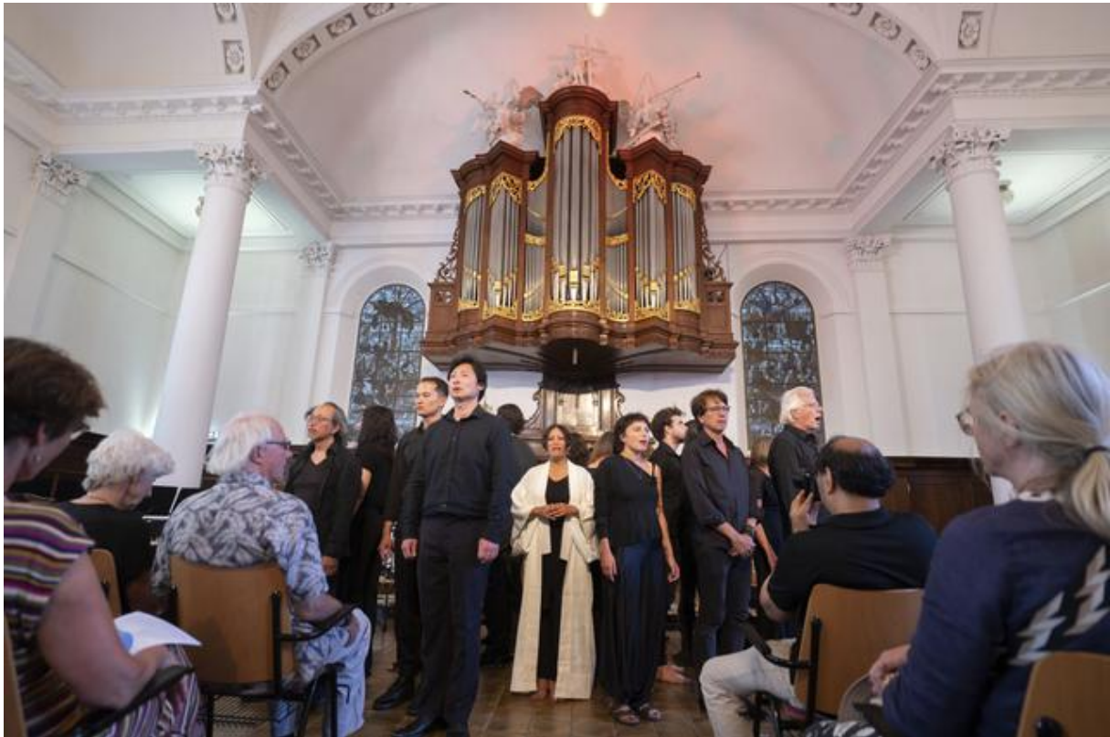
'Air Mata', ofwel 'tranen', op City Proms.

effect van een zware preek. Een van de muzikanten/koorleden was trouwens Bloem de Ligny, ooit in de markt voor een Björk-achtige popsterren carrière. Wat een subtiele onderstreping van het thema was: een bloem heeft ook water nodig, maar weer niet zo veel dat je kopje onder komt te staan.