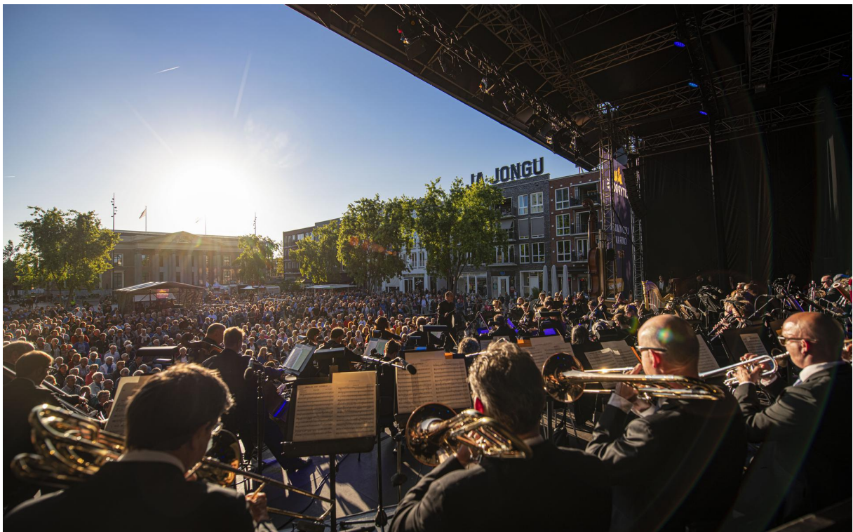
Het Noord Nederlands Orkest bij het openingsconcert van City Proms 2019, op het Wilhelminaplein.

De positie van festivals en de cultuur in Leeuwarden staat op het spel, na het definitieve afscheid van Welcome To The Village. Festival City Proms werkt toe naar een nieuwe naam, Music City Leeuwarden, en een nog bredere opzet.