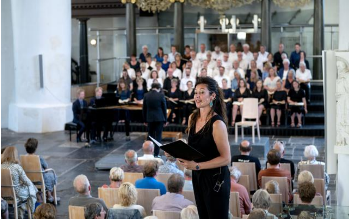
Het NHL Stendenkoor in de Grote of Jacobijnerkerk.

toevallig samen met het festival), in de Grote Kerk ontfermde het NHL Stendenkoor zich over Die Schöpfung van Joseph Haydn en het hoofdpodium was zaterdag overdag vooral voor enkele jongerenorkesten, zoals het Drents Jeugdorkest en het Frysk Jeugdorkest.