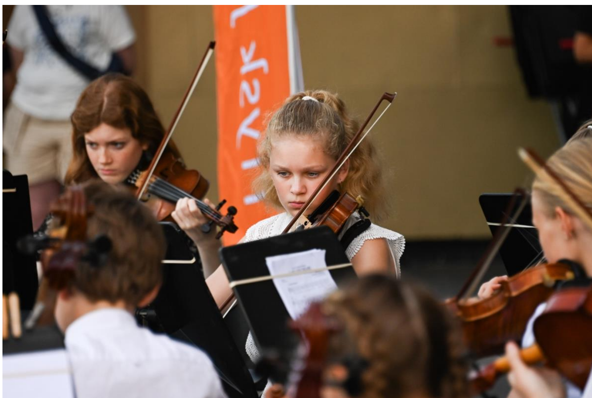
Jong Frysk Jeugdorkest

In 2022 hebben we meer focus in het programma aangebracht. Met vrijdag als de dag van de klassieke muziek en de zaterdag voor jonger publiek en jeugd (talenten). Op zondag stonden de community projecten centraal. Op alle dagen kregen amateurs naast professionals ruimte om te concineren. In 2023 hebben we vastgehouden aan deze opzet. Ook in de toekomst blijft dit de basisstructuur van het festivalprogramma in juni. We gaan echter ook door het jaar heen de amateurorganisaties ondersteunen met verdieping, kennisdeling, inspiratiesessies en coachingstrajecten.