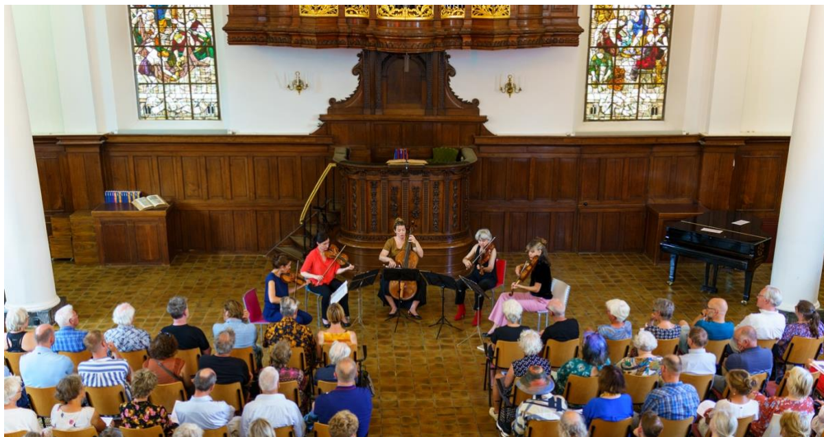
Penta Quintet