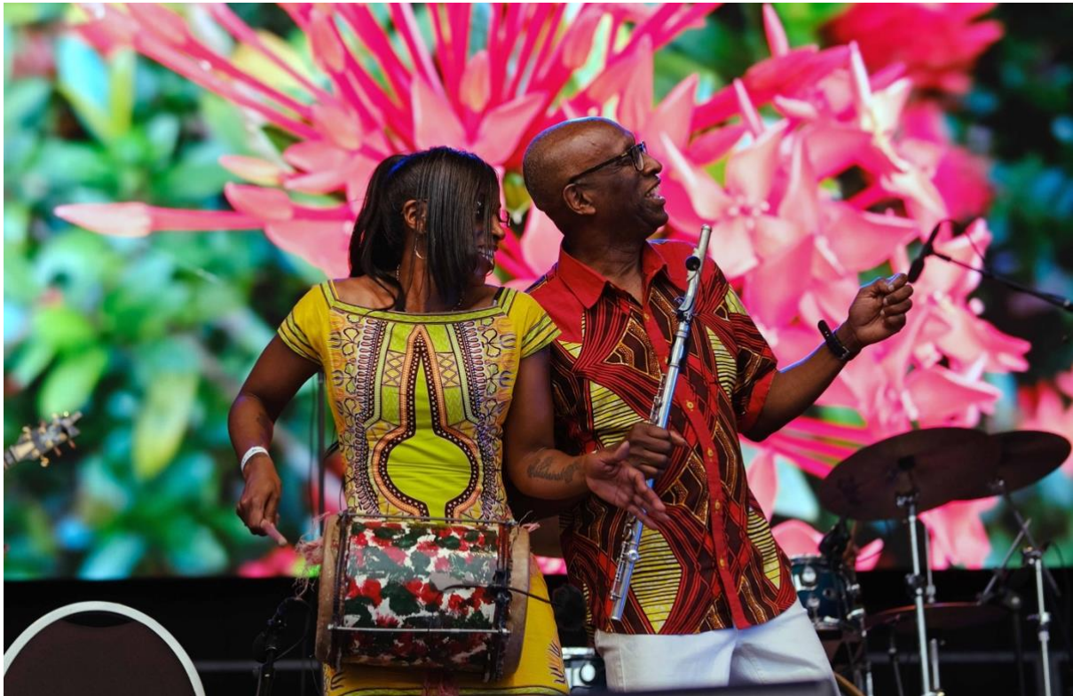
Ronald Snijders