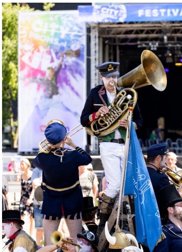
9x13 op het Wilhelminaplein

Een hoogtepunt van dit jaar was de betrokkenheid van vele professionele musici bij lezingen, symposia, workshops, masterclasses, community-projecten, educatie en coachingstrajecten. Deze intensieve interacties verrijken niet alleen de musici zelf, maar ook de amateurs en het luisterende publiek. Specifieke aandacht ging uit naar de