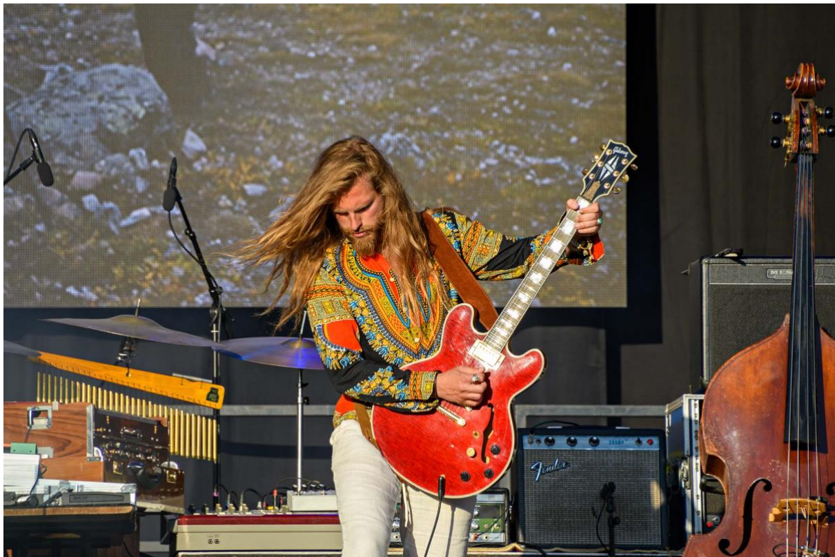
Arctic Mirage